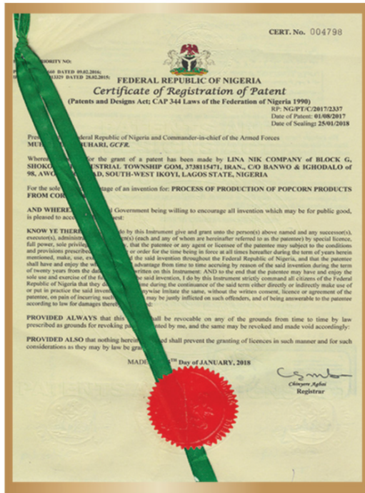
گواهی ثبت اختراع در نیجریه Patent certificate in Nigeria