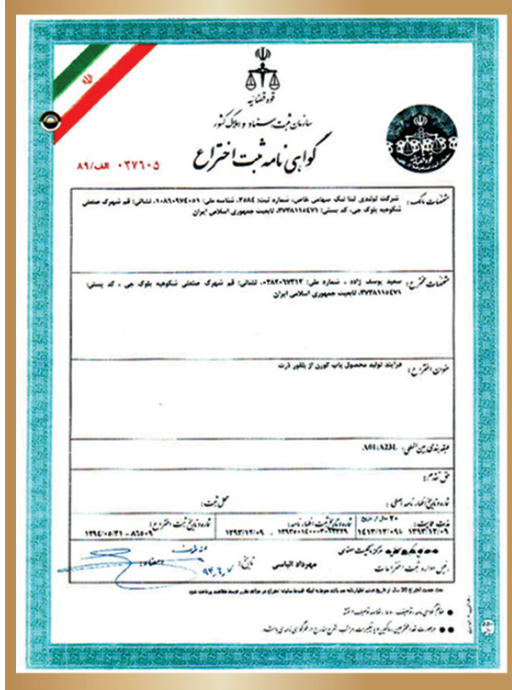
گواهی ثبت اختراع در ایران Patent certificate in Iran