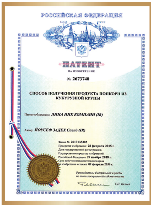
گواهی ثبت اختراع در روسیه Patent certificate in Russia