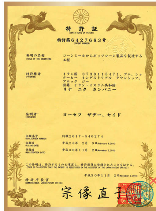
گواهی ثبت اختراع در ژاپن Patent certificate in Japan