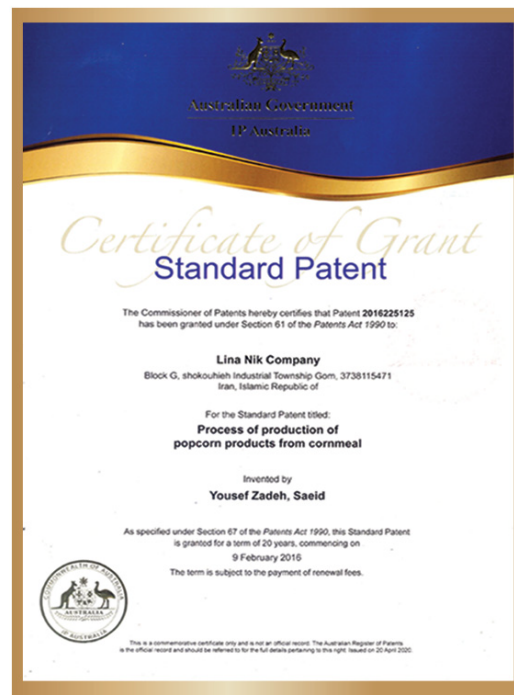
گواهی ثبت اختراع در استرالیا Patent certificate in Australia