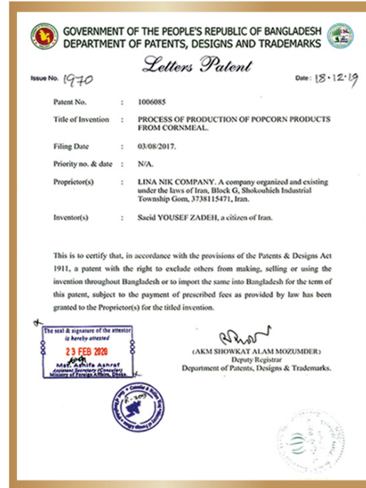
گواهی ثبت اختراع در بنگلادش Patent certificate in Bangladesh