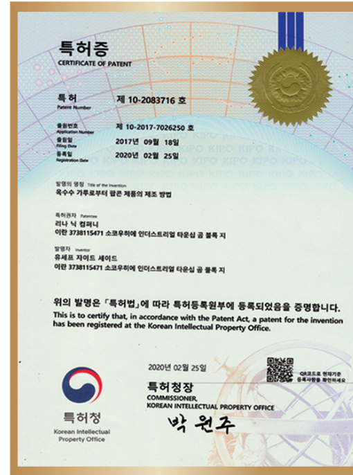
گواهی ثبت اختراع در کره جنوبی Patent certificate in South Korea